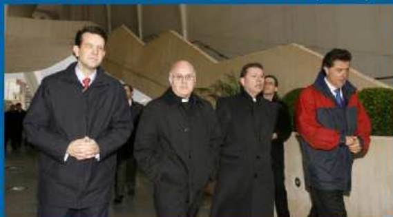
10-01-06 El presidente de la CEE, Monseñor Blázquez, visita Valencia para conocer los preparativos del EMF