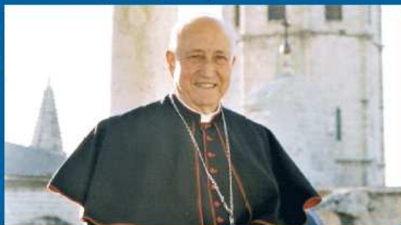
01-01-06 Monseñor García-Gasco invita a 4.000 obispos de todo el mundo al V EMF en Valencia