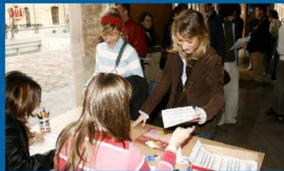
14-01-06 Comienzan las primeras entrevistas para los voluntarios del EMF.