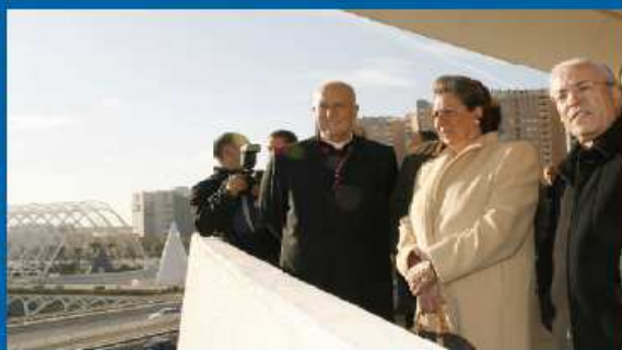
26-12-05 Monseñor Monteiro, Nuncio Apostólico del Papa en España, visita Valencia.