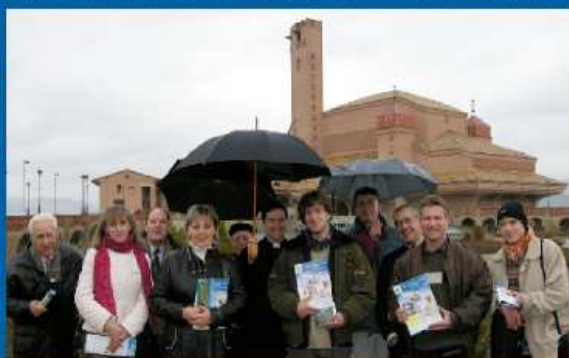
11-01-06 El Santuario de Torreciudad informa a peregrinos de distintas nacionalidades sobre el EMF.