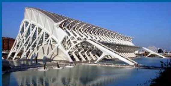
09-01-06 El Gabinete de Comunicación del EMF se instala en el Museo de las Ciencias Príncipe Felipe.