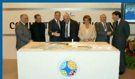
26-01-06 El V EMF se presenta en la Feria Internacional de Turismo (FITUR) de Madrid.