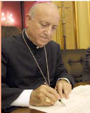
Monseñor Agustín García-Gasco.

El arzobispo de Valencia, monseñor Agustín García-Gasco, ha enviado invitaciones, escritas personalmente por el prelado, a los más de 4.000 obispos titulares de todas las diócesis de la Iglesia Católica en los cinco continentes para el V Encuentro Mundial de las Familias. En las invitaciones, monseñor García-Gasco anima a los obispos a participar en el EMF y en la eucaristía conclusiva de las jornadas que presidirá Benedicto XVI el domingo 9 de julio en Valencia. Estas invitaciones se remitirán a los titulares de las diócesis de África, Asia y Oceanía.