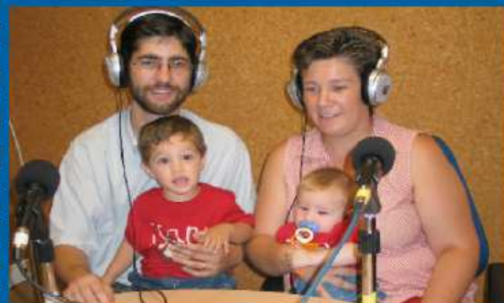
17-01-06 Un centenar de familias valencianas participa en la grabación de los anuncios promocionales del EMF.