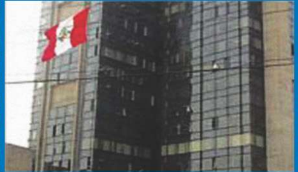
23 a 25-9-05 El Auditorio Petroperú de Lima alberga el VII Congreso Nacional Escuela de Padres "Familia, constructora de paz y comunión".