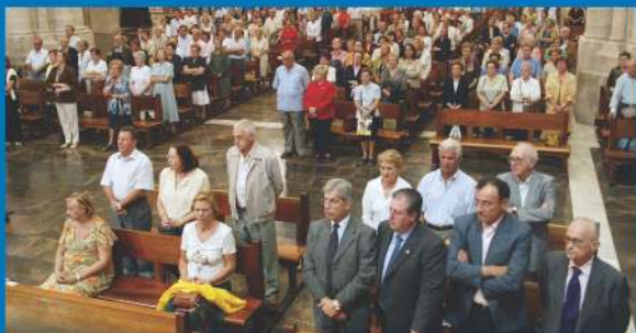
20-9-05 El Arzobispo de Valencia celebra una misa en la catedral con todos los movimientos, asociaciones y foros familiares como inicio del curso de preparación del EMF.