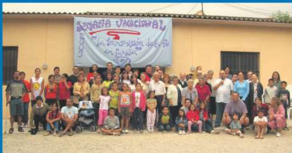
11-9-2005 La Fraternidad Misionera Verbum Dei celebra su I Semana Vacacional dirigida a la familia y programa un retiro familiar mensual hasta el EMF.