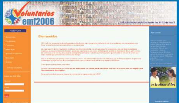
23-9-05 La web del V EMF abre el plazo para inscribirse como voluntario y en pocas horas se reciben un centenar de solicitudes.