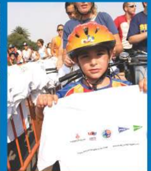
25-9-05 Los participantes en el Día de la Bicicleta recorrieron doce kilómetros de itinerario por la ciudad de Valencia con dorsales y camisetas del V EMF.