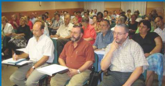
13-9-05 El Foro de Laicos inicia el curso bajo el EMF en 2006.