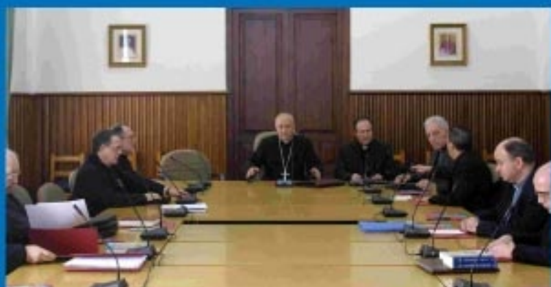
Comienzan los preparativos con la reunión del consejo episcopal de la diócesis.