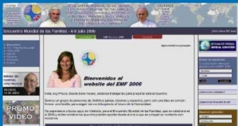
Página de bienvenida del "website" del V EMF.