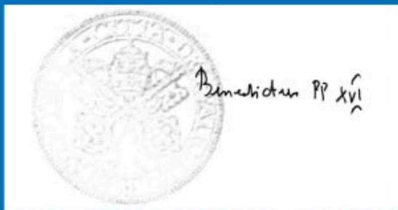
El Papa Benedicto XVI ratifica la designación de Valencia como sede del EMF.