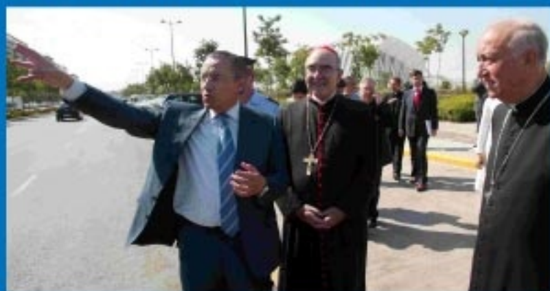
Monseñor López Trujillo visita la capital del Turia.