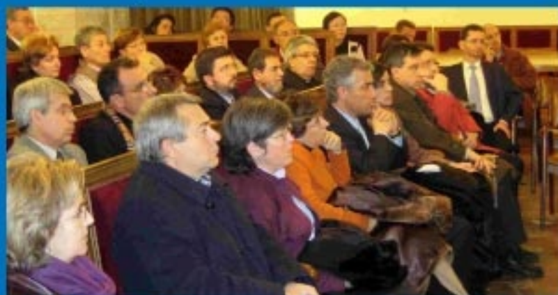
El Arzobispo de Valencia se reúne diferentes movimientos de familia.