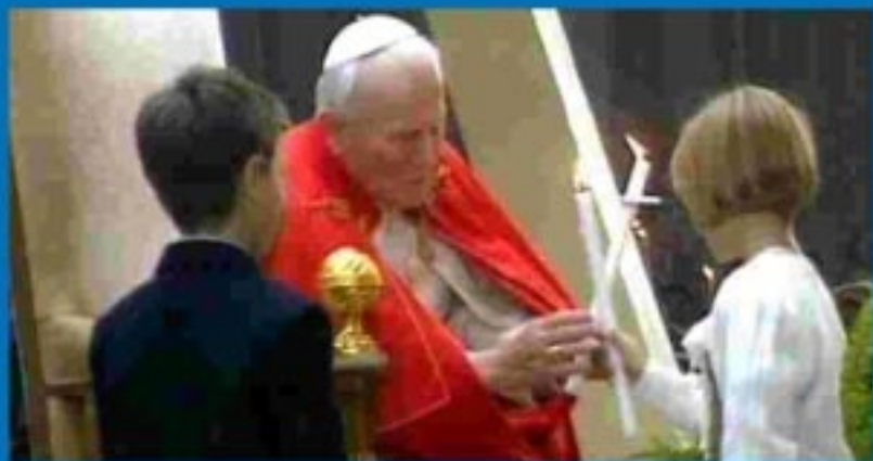
Juan pablo II anuncia la convocatoria del V Encuentro Mundial de las Familias para 2006 en Valencia.