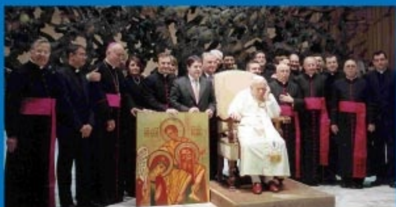
Juan Pablo II entrega en el Vaticano el icono de la Sagrada Familia.