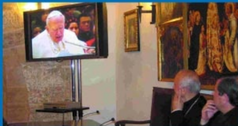
Se estrena el video promocional.