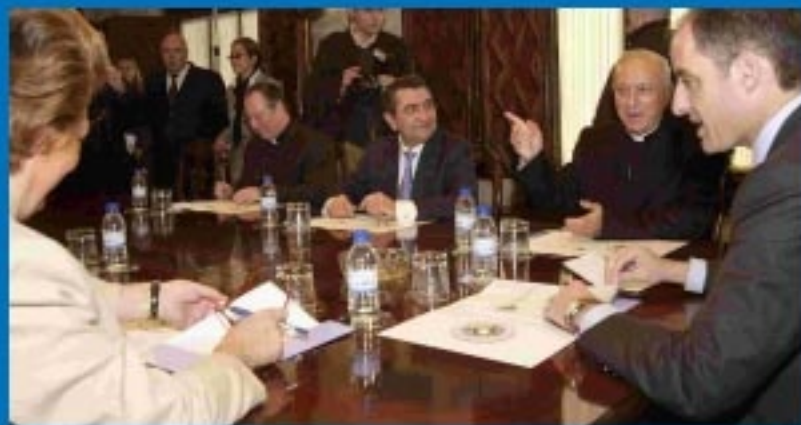
Creación de la Fundación de la Comunidad Valenciana "V Encuentro Mundial de la Familia 2006".