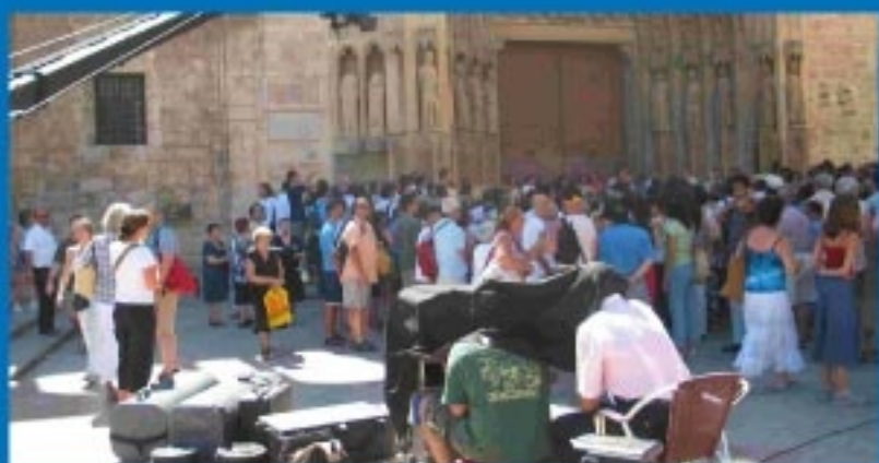
Se rueda el vídeo promocional del encuentro.